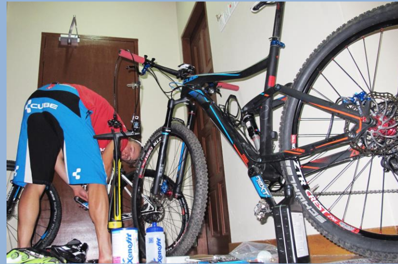
Ohne das vertraute Team, muss man sich um alles selber kümmern.