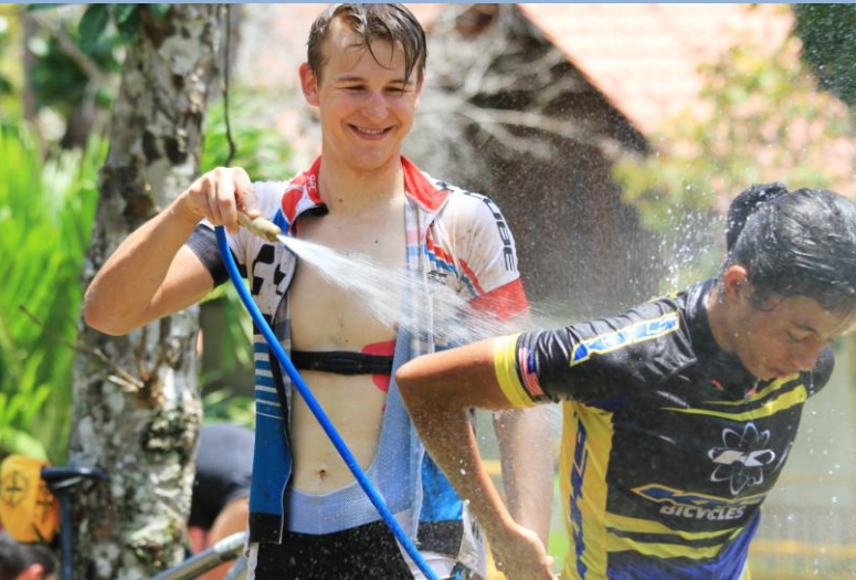
Gemeinsame Erfrischung nach dem Rennen

„Danke Malaysia- für zwei tolle Wochen und klasse Sport mit netten Menschen- Danke Langkawi - Bike your dream!“