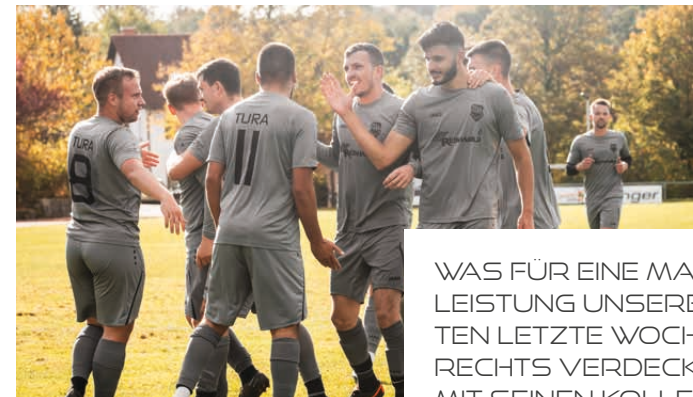
WAS FÜR EINE MANNSCHAFTS-LEISTUNG UNSERER ZWEITEN LETZTE WOCHE. "BULLE" RECHTS VERDECKT FREUT SICH MIT SEINEN KOLLEGEN.